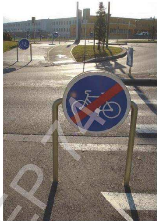
Aménagement autour du giratoire d'accès au Centre Hospitalier de Metz-Tessy

La seconde solution répond mieux aux attentes des randonneurs cyclistes et des cyclistes expérimentés qui se sentent plus en sécurité sur la chaussée principale: elle consiste à intégrer une bande cyclable à l'intérieur de l'anneau. Il est toutefois nécessaire qu'elle soit bien identifiable et bien lisible au sol par l'ensemble des usagers.