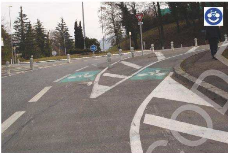
Séparation en 2 branches de la bande cyclable à l'entrée du giratoire Avenue de Sévrier à Cran-Gévrier facilitant le tourne à droite des cycles en toute sécurité (quilles de protection)