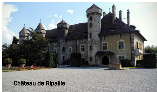
Château de Ripaille

Le port de Thonon (parking gratuit) constitue le point de départ et d'arrivée de ce Tour du Léman Cyclo,