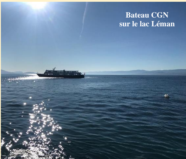
Bateau CGN sur le lac Léman