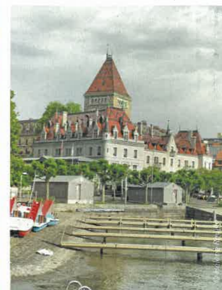
Le château d'Ouchy à Lausanne.