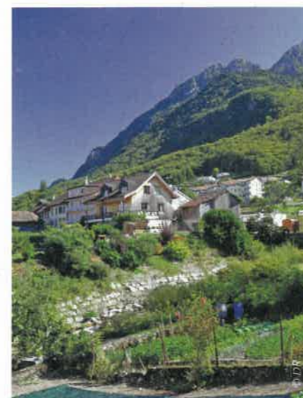
Le village de Saint-Gingolph (74 - Haute-Savoie).

Après Lausanne, le circuit se prolonge sur la corniche vaudoise : le vignoble en terrasse de Lavaux surplombe les eaux du lac, avec en arrière-plan les montagnes, certaines enneigées : ce lieu féérique est inscrit au patrimoine mondial par l'Unesco. Vevey est attachée à l'inoubliable Charlot qui vécut ici les vingt-cinq dernières années de sa vie (cf. encadré). Le château de Chillon bâti sur un îlot au bord du lac (XIII e siècle) domine le lac. Le franchissement du pont de la Morge à Saint-Gingolph (BCN-BPF) nous fait quitter la Suisse pour arriver en France. Après la Meillerie, le route se faufille entre les pentes raides du Chablais sur la gauche, et le bord du lac sur la droite. Évian-les-Bains, ville thermale réputée au niveau mondial, offre sa promenade en front de lac, sa buvette Cachat de style Art nouveau. De retour à Thonon-les-Bains ne pas manquer la visite du domaine de Ripaille. ■