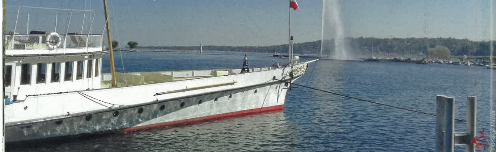
Le lac Léman à Genève et son célèbre jet d'eau dans la rade.

Un croissant : telle est la forme du plus grand lac des massifs alpins. Une couleur : le bleu, plus ou moins argenté, tel un ciel qui se reflète dans ses eaux. Au menu : des rives, et des coteaux pour une infinité de panoramas avec en arrière-plan la montagne omniprésente. Une balade inoubliable proposée par les cyclos de Thonon-les-Bains.